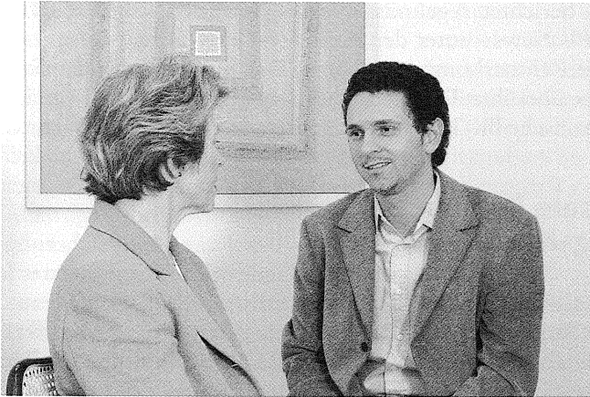
Beratungsgespräch bei GGG Voluntas

im Voraus formulierten, resp. bekannten Willen angewiesen. Diesem Zweck dient die Patientenverfügung. Darin kann jeder zum Zeitpunkt der Urteilsfähigkeit für die Zeit der Urteilsunfähigkeit seinen Willen im Bezug auf eine medizinische Behandlung verbindlich festlegen. Er kann darin, neben therapieorientierten Massnahmen, auch Angaben machen zu persönlichen Werthaltungen und zur Art und Weise, wie er sein eigenes Leben und Sterben sieht. Darüber hinaus enthält die Patientenverfügung auch Angaben zu Vertrauenspersonen, behandelnden Ärzten, Seelsorgern, etc., die in der Entscheidungsfindung wichtige Referenzen bilden.